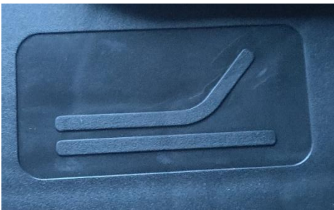
Afbeelding 1 – hoofdeind: